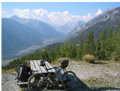
Kurz vor Montgenevre

Der Weiterweg besteht aus einer mit ausgesprochen vielen großen Steinen übersäten Piste, die den Federelementen das Öl aus den Poren treibt. Erst im unteren Teil der Piste sehen wir zwei Radler, die auf der anderen Talseite auf einem wunderschönen Wanderweg dem Tal entgegen gleiten. Die Piste geht an einem großen Parkplatz schließlich in eine asphaltierte Strecke über und führt uns weiter in die Ortschaft Nevache. Obwohl es hier sicher gut zu übernachten wäre, wollen wir noch weiter. Durch den verlorenen Tag liegen wir schließlich weit hinter unserem Zeitplan zurück und können uns keine weiteren Zeitverluste mehr erlauben.