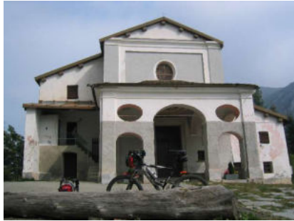
Madonna del Coletto

Kilometer flussabwärts, gleiten an den Grotte del Bandito vorbei in das nach Roaschia führende